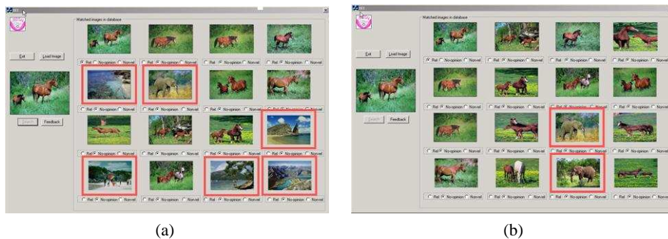
Figure 1. (a) Les seize premiers résultats sans retour de pertinence, les images en rouge sont les images non pertinentes, les autres sont pertinentes (b) Les seize premiers résultats quand on fait une fois le retour de pertinence

Pour comparer les résultats avec notre interface graphique 2D, nous avons développé une interface traditionnelle (fig. 1.a). La méthode de retour de pertinence [RUI 98] a été appliquée. Dans cette interface, l'image requête est à gauche, les seize premières images résultats sont affichées à droite, sous chaque image résultat, on a trois options à choisir (pertinente, neutre, non-pertinente) pour faire le retour de pertinence. Avec la méthode de Rui, les deux descripteurs utilisés sont la couleur et la texture (quatre représentations utilisées pour la couleur : l'histogramme [SWA 91](RVB et TSV), les moments [STR 95](RVB et TSV) et une représentation utilisée pour la texture : les matrices de co-occurrences [HAR 73]). La figure 1 montre un résultat de cette méthode avec l'interface traditionnelle. Dans cet exemple, l'utilisateur veut chercher des images contenant un (des) cheval (chevaux). L'image (a) montre les seize premiers résultats, les images en rouge sont les images non pertinentes, les autres sont pertinentes. L'image (b) montre les seize premiers résultats quand on fait une fois le retour de pertinence. Le nombre d'images non-pertinentes diminue et leurs rangs sont beaucoup plus élevés (pertinence faible) que ceux des images pertinentes (premiers rangs).