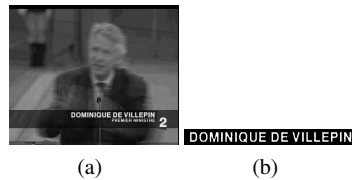
Figure 2. Images moyennes et binarisées

La reconnaissance du texte est effectuée toutes les 10 trames entre la trame d'apparition du texte et sa trame de disparition. Ces multiples détections nous permettent d'avoir plusieurs possibilités de retranscription de chacun des textes. Ces multiples possibilités sont fusionnées pour obtenir la transcription la plus probable.